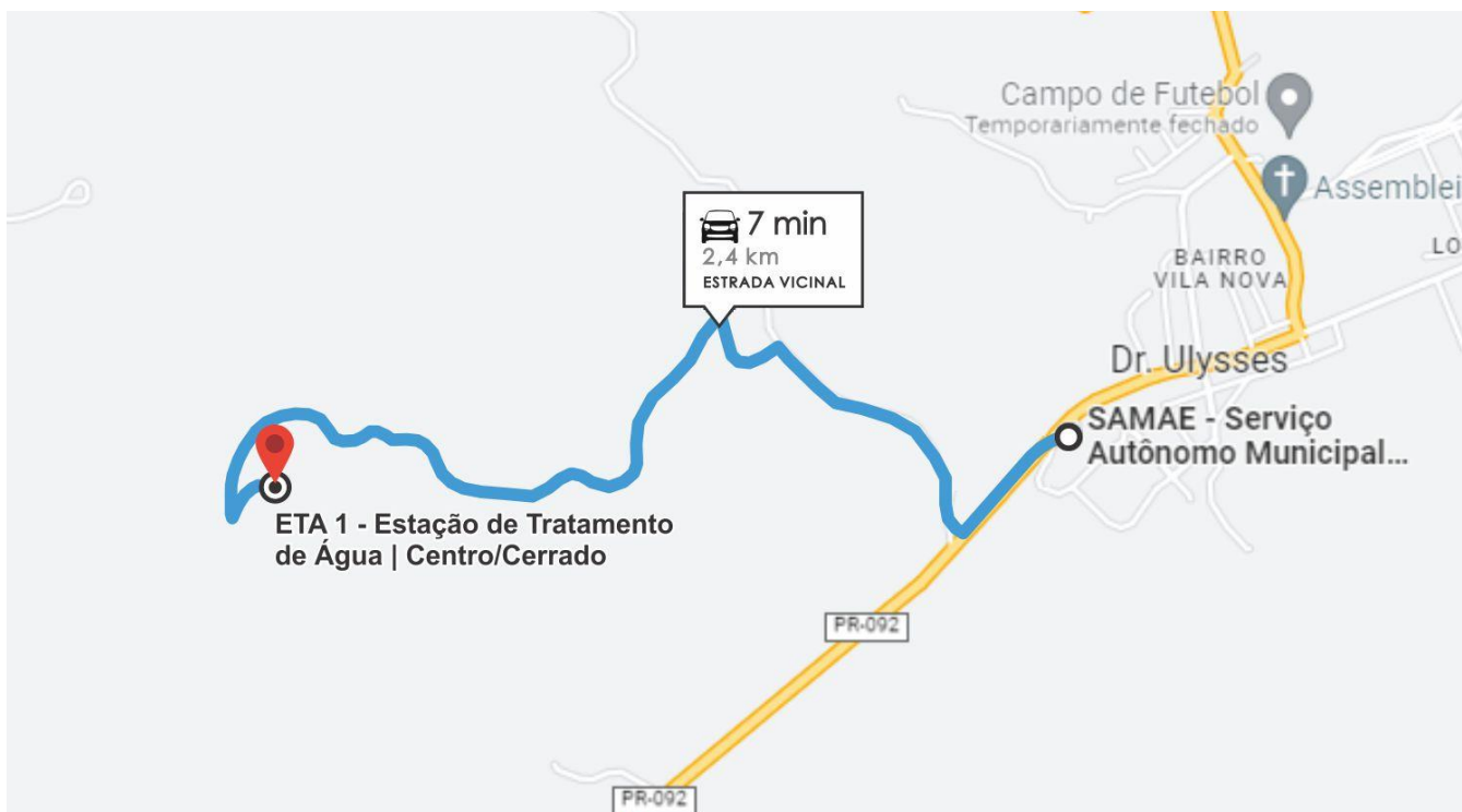
Anexo 02 - Localização da UTA 1 - Unidade de Tratamento de Água - Centro/Cerrado Coordenada Geográfica: 24°34'12.80"S | 49°26'18.10"W Trajeto: Estrada não pavimentada