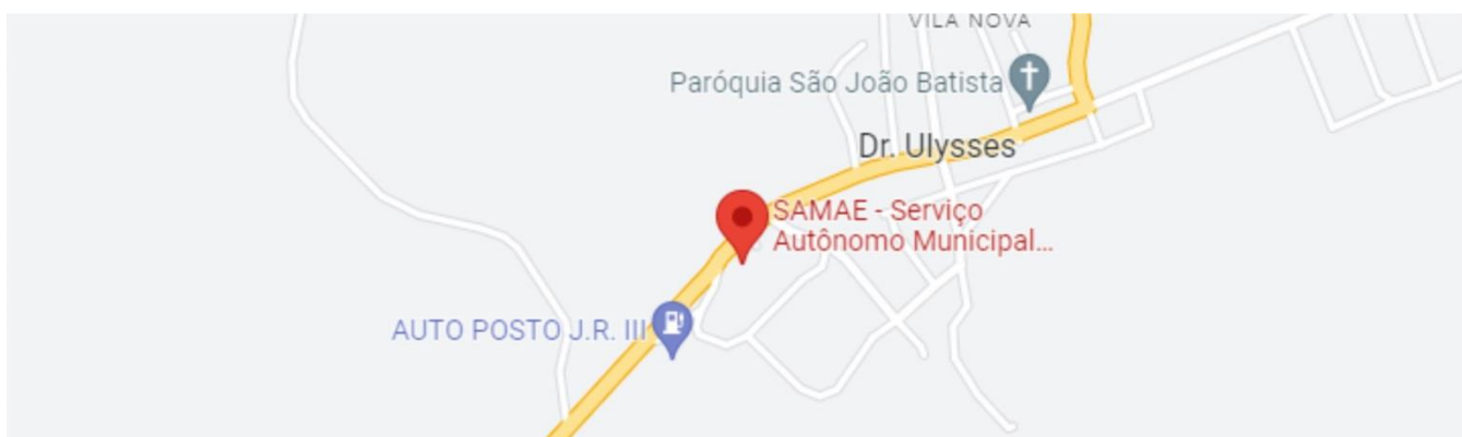
Anexo 01 - Localização do SAMAE - Serviço Autônomo Municipal de Água e Esgoto Avenida São João Batista, s/n° - Centro - Doutor Ulysses - Paraná